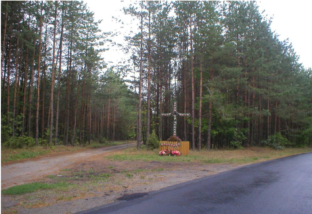
Krzyż drewniany na rozstaju dróg.