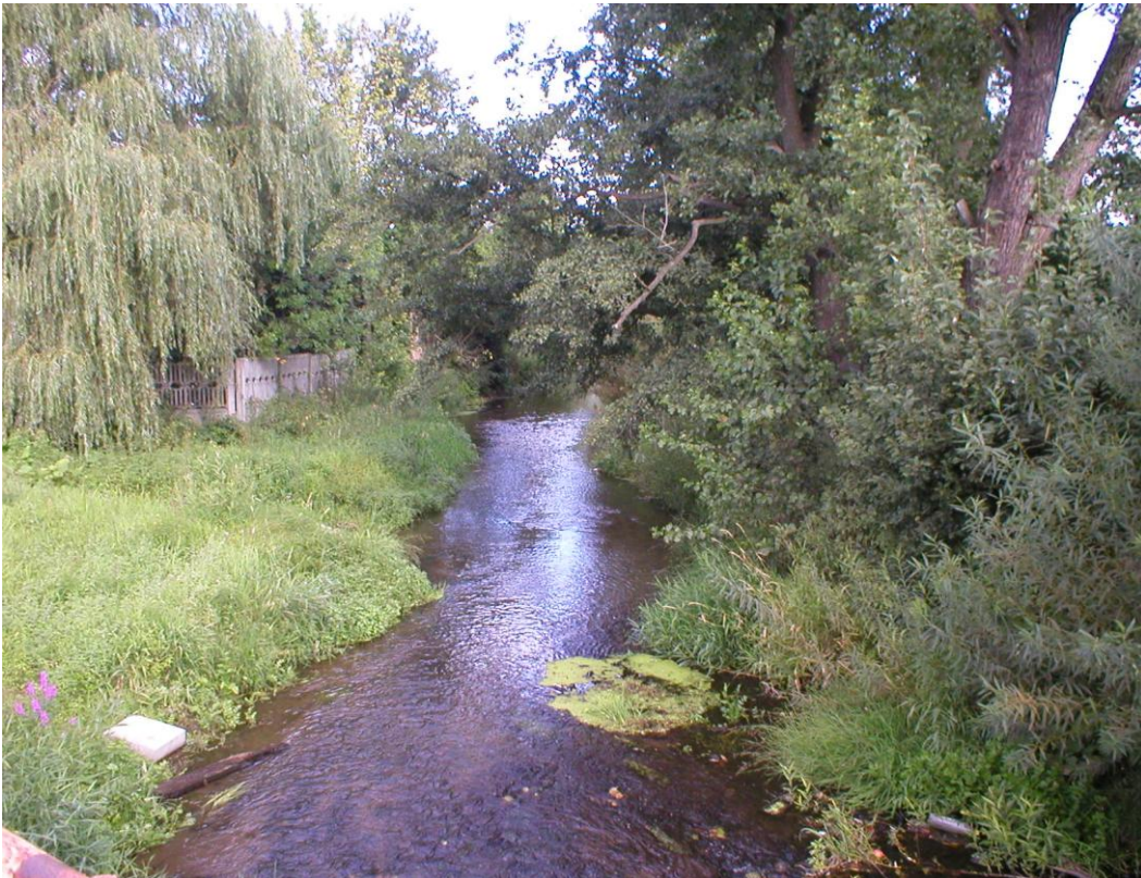
Malownicze zakątki nad rzeką Biała Oksza.