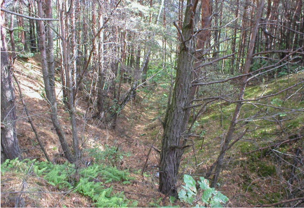
Małe wąwozy w lasach Borowej