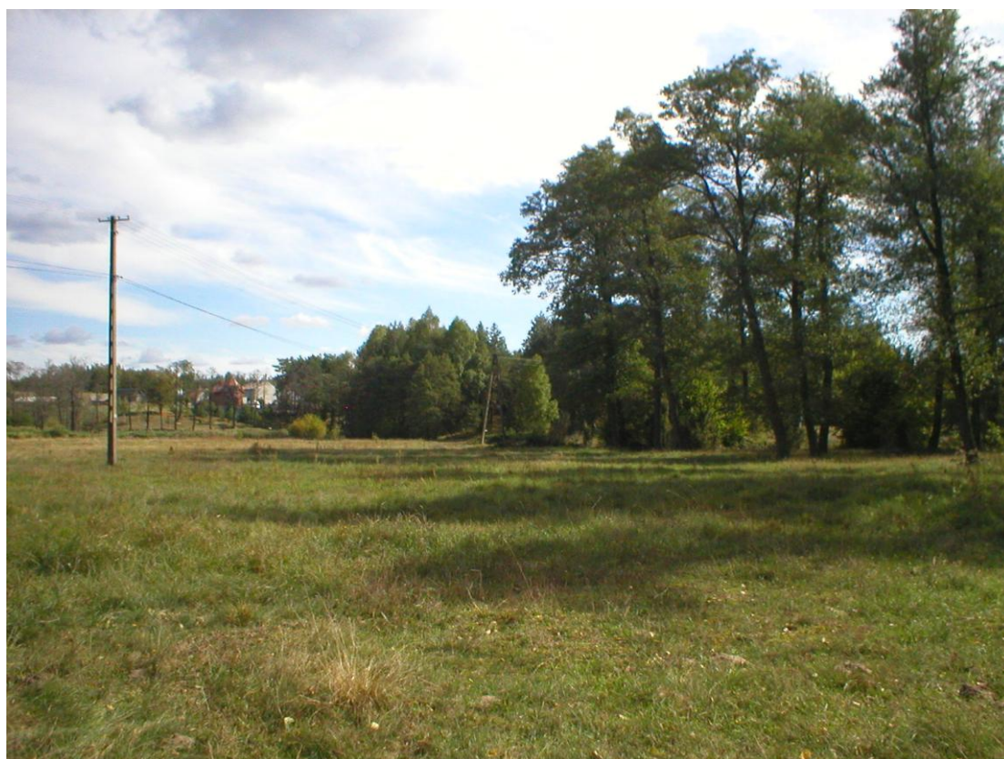
Panorama na wieś – ostoja ciszy i spokoju.

Miejscowość Borowa charakteryzuje się zabudową wsi tzw. widlicą, gdzie zabudowa usytuowana jest wzdłuż kilku dróg.