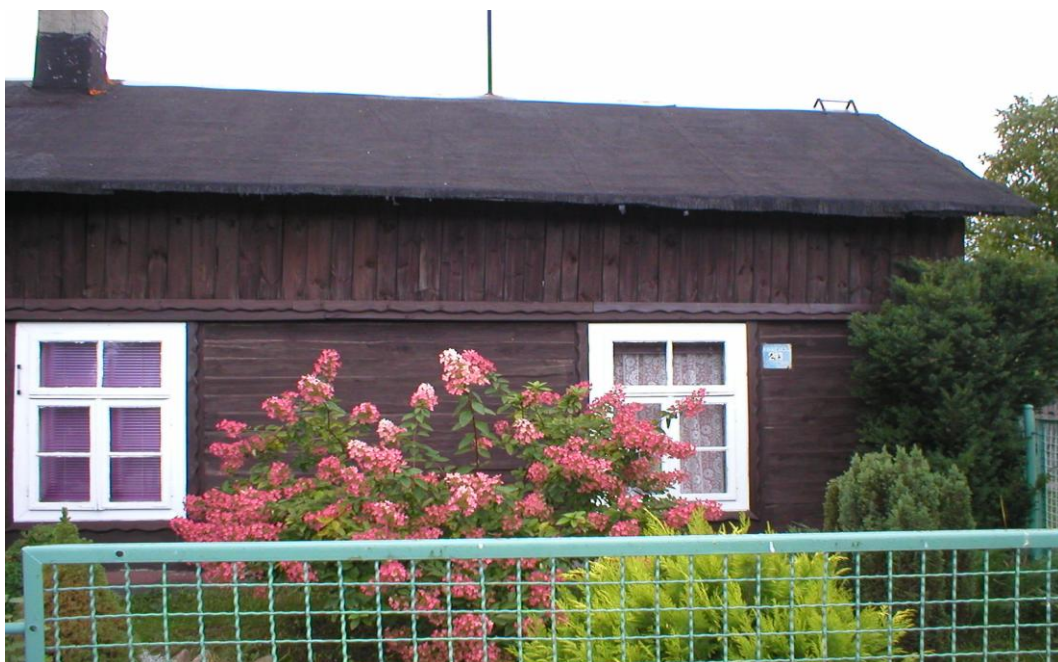
Kołaczkowice Małe – Dom drewniany pobudowany prawdopodobnie ok. 1900 – 1902 roku. Kryty był gontem, obecnie papą.