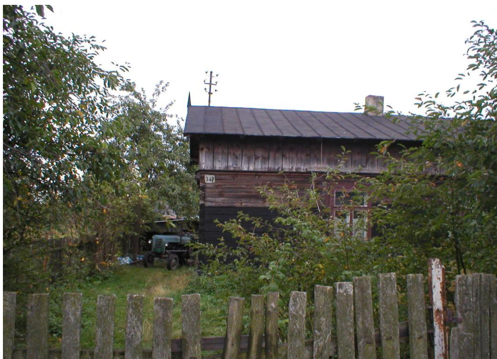
Kołaczkowice Małe – Dom drewniany z początku XX wieku pobudowany ok. 1910 roku. Dom drewniany, podłogi drewniane, belki, obecnie kryty papą, przedtem gontem.