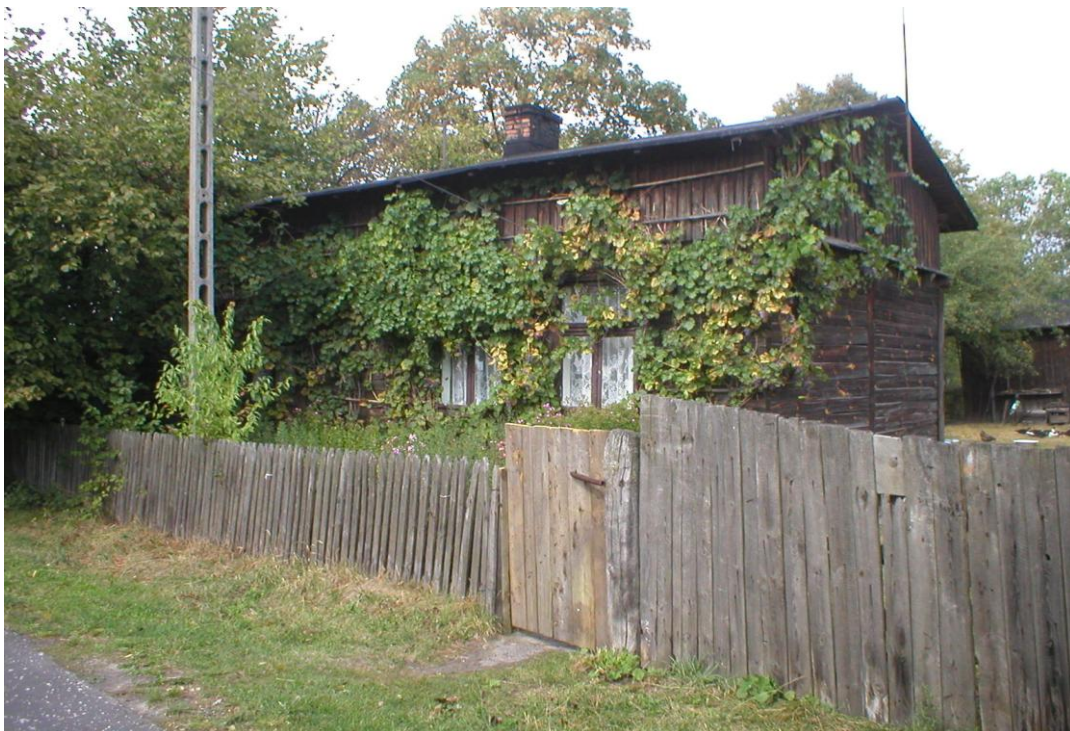
Kołaczkowice Duże – Dom ma ponad 100 lat. Bele drewniane, podłoga drewniana, pod sufitem belki, obecnie kryty papą, przedtem gontem.