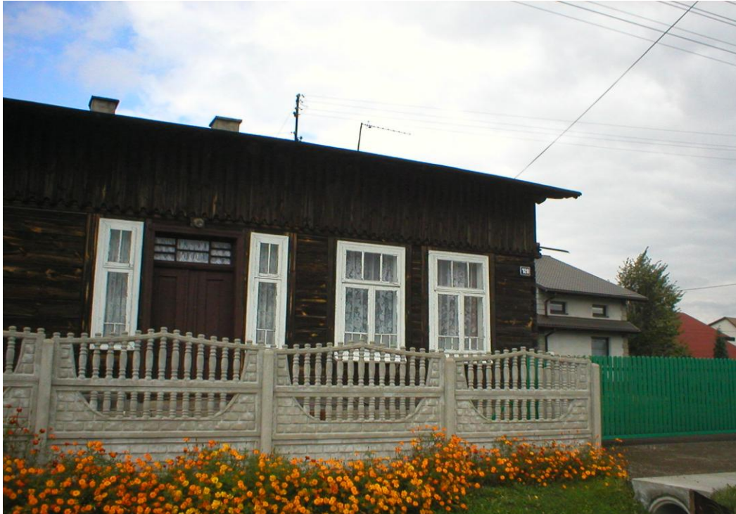
Kołaczkowice Duże – Dom drewniany pobudowany na początku XX wieku. Charakterystyczne wejście do domu dzielące dom na dwie części.