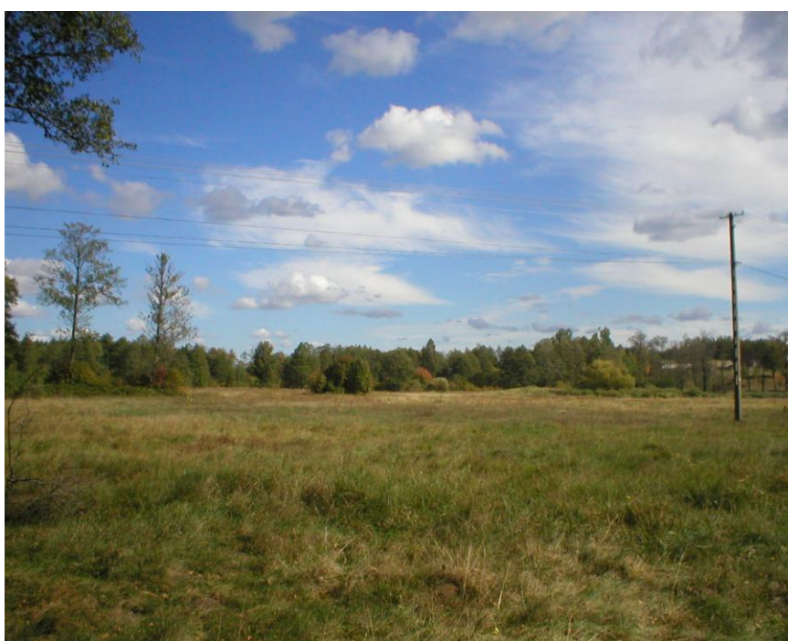
Panorama na lasy wsi Mokra

Na terenie miejscowości Mokra występują ekosystemy leśne, głównie lasy sosnowe jak również lasy mieszane złożone z borów sosnowo – dębowych i dębowych, a także lasów dębowo – grabowych.