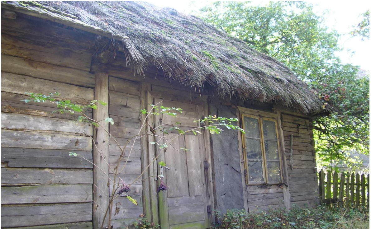
Mokra II – Dom drewniany z roku 1912. Dom drewniany, przykryty strzechą. Polepa, belki pod stropem.