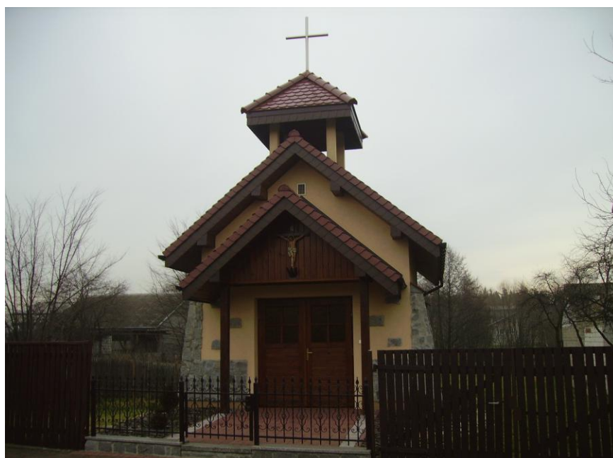
Kapliczka po przebudowie

4. Dom z 1920 roku Dom drewniany, belki powała, polepa, komin murowany z kamienia. Z boku domu znajduje się obora dla zwierząt. Budowano to w celu aby utrzymać większą temperaturę w budynku w zimie.